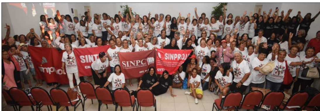
ATIVIDADE política e festiva reuniu mais de 200 pessoas no Centro de Formação e Lazer do SINDSPREV/PE

O SINPROJA, juntamente com o SINTEPE, SINPC e SINPMOL, promoveram o I ENCONTRO ESTADUAL DOS/AS APOSENTADOS/AS DA EDUCAÇÃO DOS SINDICATOS FILIADOS À CNTE, EM PERNAMBUCO. O evento aconteceu no Centro de Formação e Lazer do SINDSPREV/PE, em 24/01, comemorando o Dia dos/as Apos-